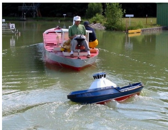
Remorqueur VOITH SCHNEIDER en traction indirecte

Pour d'autres informations, nous vous invitons à visiter le site : www.portrevel.com .