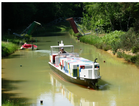
Porte-conteneurs NORMANDIE dans le Canal de Suez de Port Revel

Ceux qui ont fréquenté les deux estiment que la formation sur les modèles réduits est complémentaire de la formation sur simulateur électronique. En effet, si la manœuvre proprement dite avec courants, houles, remorqueurs, ancres, effets de berges, etc. est mieux reproduite en modèle réduit, le simulateur numérique est plus réaliste pour ce qui concerne l'environnement de la passerelle.